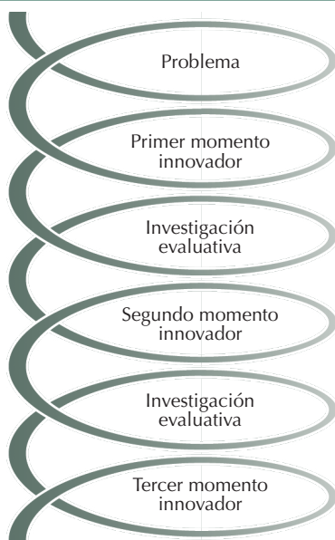
Gráfica 1. Recorrido modal de la trayectoria recursiva.

A continuación, en la gráfica 1, presentamos la trayectoria modal que denominamos recursiva. Ella implica una condensación de las recurrencias encontradas en cada uno de los recorridos de las innovaciones descritas. La trayectoria modal, sostiene